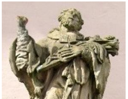
Bild: Statue des Hl. Nepomuk vor der Kirche St. Ludwig in Eschbach

Die Ortsgemeinde und der Förderverein „Bildhäusel e.V.“ laden zum anschließenden gemeinsamen Beisammensein mit Imbiss auf dem Kirchplatz neben der Kirche oder je nach Wetterlage ins Pfarrheim ein.